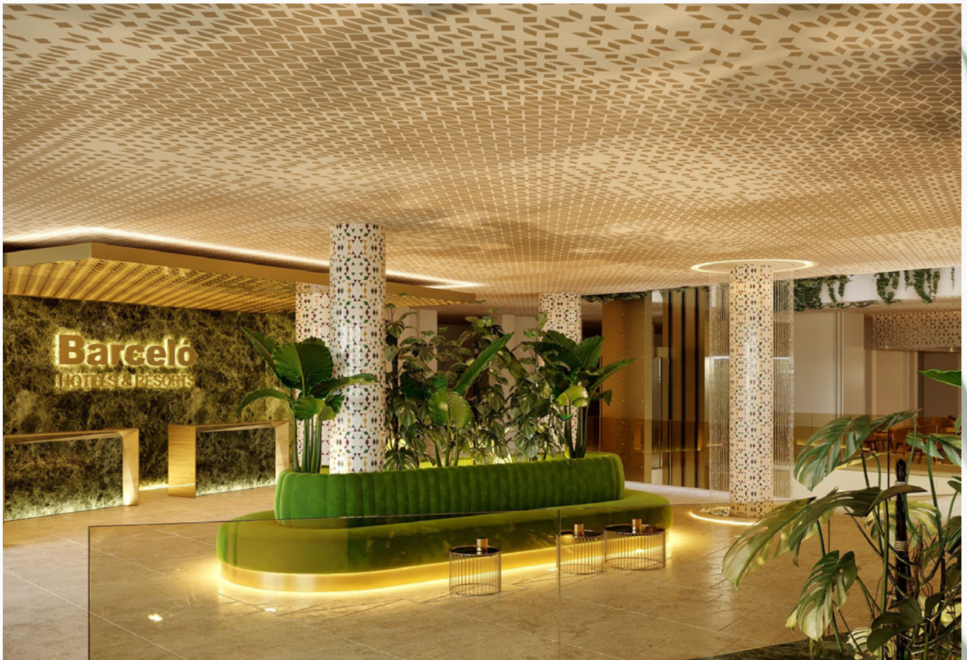
Barceló Carmen Granada (España).